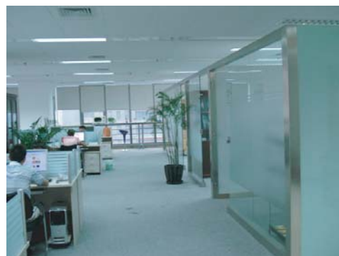
公司位于金泰国际大厦的北京办公室照片